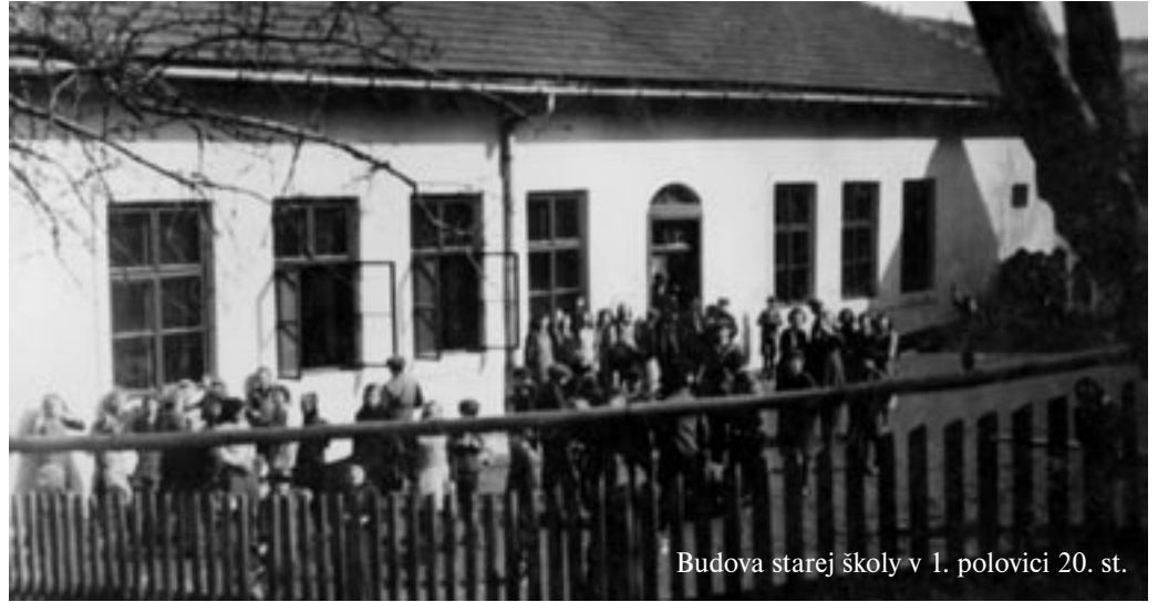
Budova starej školy v 1. polovici 20. st.