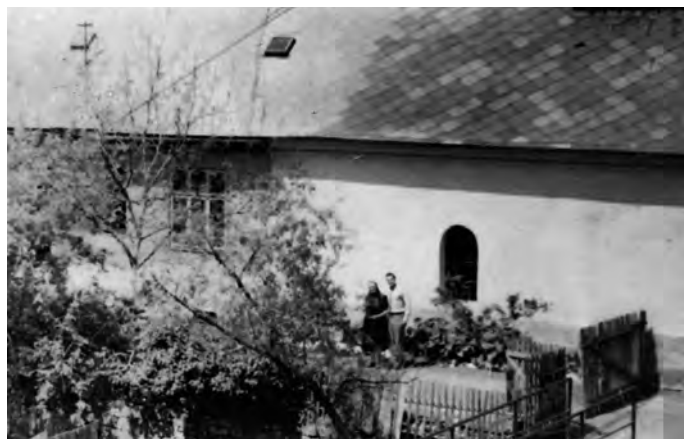
Pôvodne kološtovský, neskôr murgašovský domček za kostolíkom