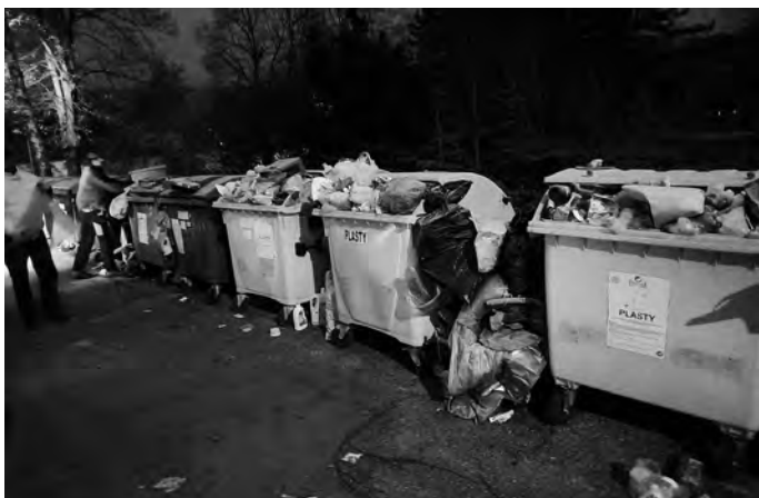
Opad uložený mimo zberných nádob v miestnej časti Dubová

Chceli by sme upozorniť občanov, že je zakázané ukladať alebo ponechať odpad na inom mieste ako na mieste na to určenom. Hlavne nie je dovolené ukladať odpad mimo zberných nádob. Uvedený zákaz upravuje ustanovenie § 13 písm. a) zákona č. 79/2015 Z. z. o odpadoch. Každý je teda povinný uložiť alebo ponechať odpad v príslušných kontajneroch, odpadových košoch a pod. V opačnom prípade pácha priestupok, za ktorý je možné podľa ustanovenia § 115 ods. 2 zákona o odpadoch uložiť pokutu až do výšky 1500 eur.