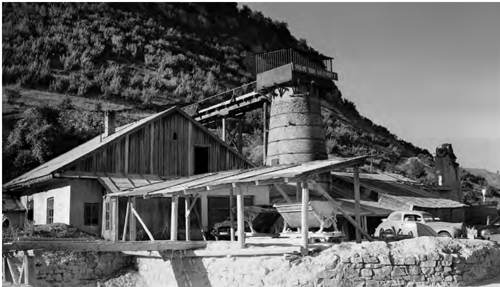
Areál vápenky po skončení vojny

podrobne vyrozprával, čo sa pri vápenke dialo. Na druhej strane sa snažil vyvliecť zo zodpovednosti, že celú akciu riadil on, že gardisti riadili vraždenie aj obsluhu pece. Neľutoval, že páchaným zverstvám nezamedzil, ale mrzelo ho, že sa so spoluobvinenými nedohodol, ako budú vypovedať a ako čo najviac viny poprieť. Na jednej strane sa veľmi bál o svoj život a o to, čo s ním ďalej bude, na druhej strane mu bolo ľúto, že nestačili