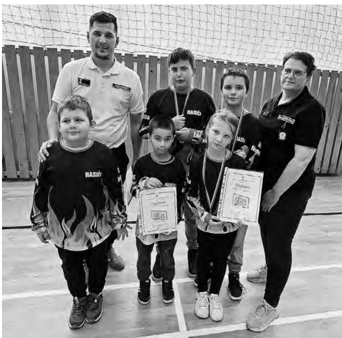
Družstvo mladších chlapcov s najmladšími súťažiacimi

Ako vždy, aj teraz sa môžeme pochváliť nádhernými výsledkami.