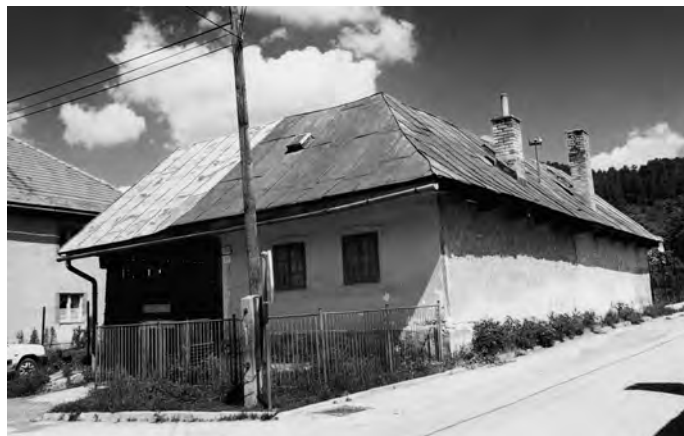
Stará kološtovská drevenica s krytým podbráním v roku 2003