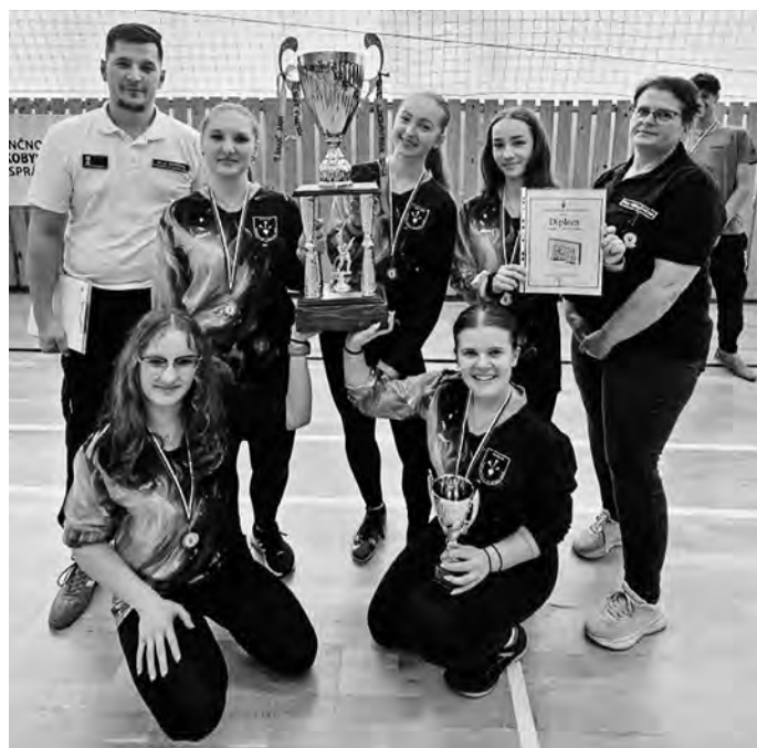
Vítané družstvo starších dievčat s putovným pohárom