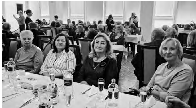
Medzinárodný deň žien vo Zvolene

sa presunuli do Popradu, kde sme si v Podtatranskom múzeu pozreli zaujímavú expozíciu o hrobke germánskeho kniežata z Popradu.