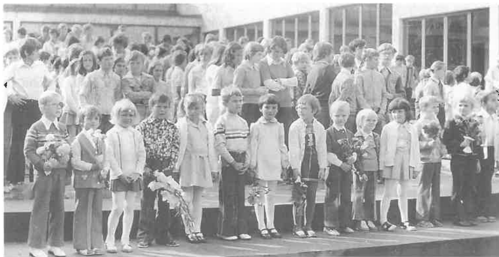
Začiatok školského roka 1976/1977