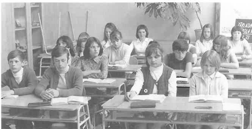
Prví deviatci novej školy v roku 1973