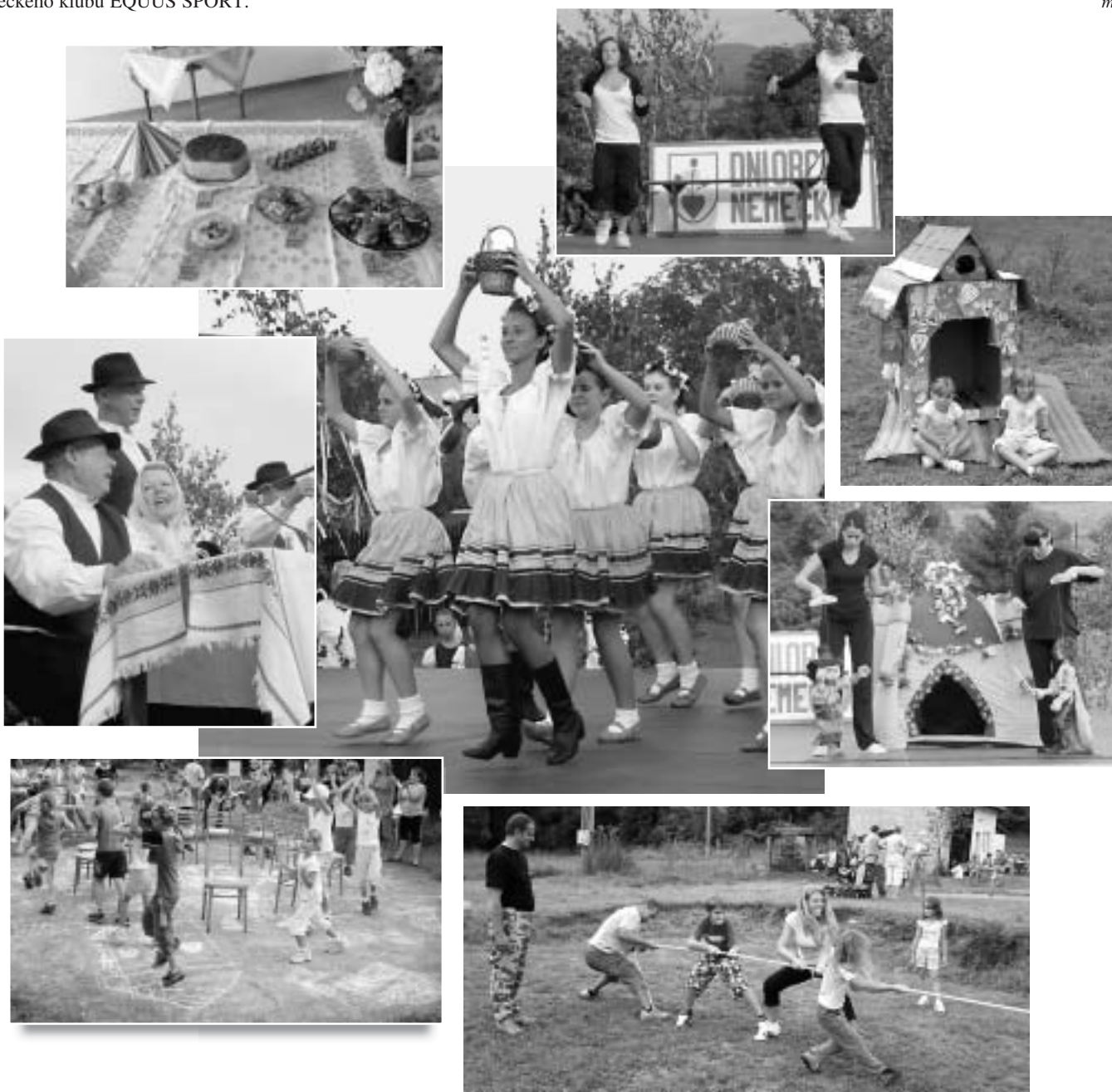
Dovidenia na Dňoch obce Nemecká v roku 2009!