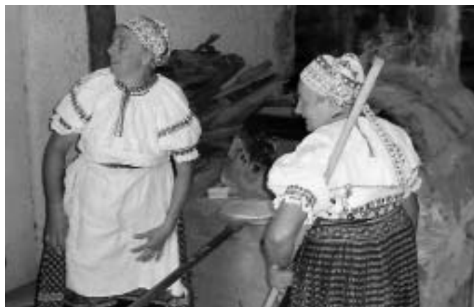
Zábery z vystúpení FSK Čierťaž a z atmosféry festivalu v Hrušove