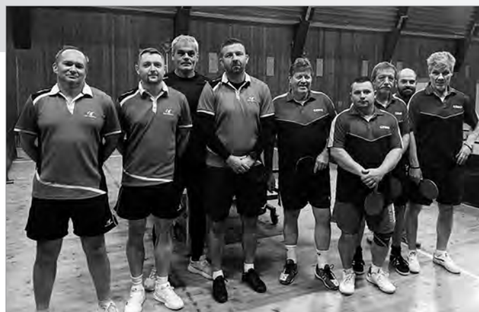
Pred zápasom 9. kola 4. ligy s Medzibrodcom A

Peter Sojak, vedúci klubu