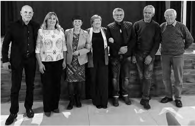
Mesiac úcty k starším v Kultúrnom dome v Nemeckej

V „dolnej škole“ v Zámostí sme pripravili pre našich členov predvianočnú kapustnicu, ktorá sa už v našej ZO stala tradíciou. Kapustnicu navarili a posedenie pripravili členovia výboru, za čo im ďakujem. Predvianočnú náladu nám umocnila návšteva koncertu Šláger paráda v Banskej Bystrici.