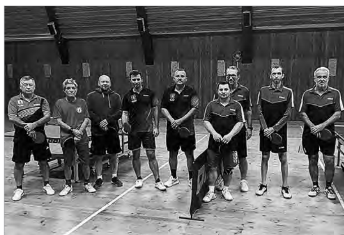
Pred zápasom 7. kola 5. ligy s Lubietovou B