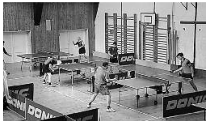
Zápasy v skupinách