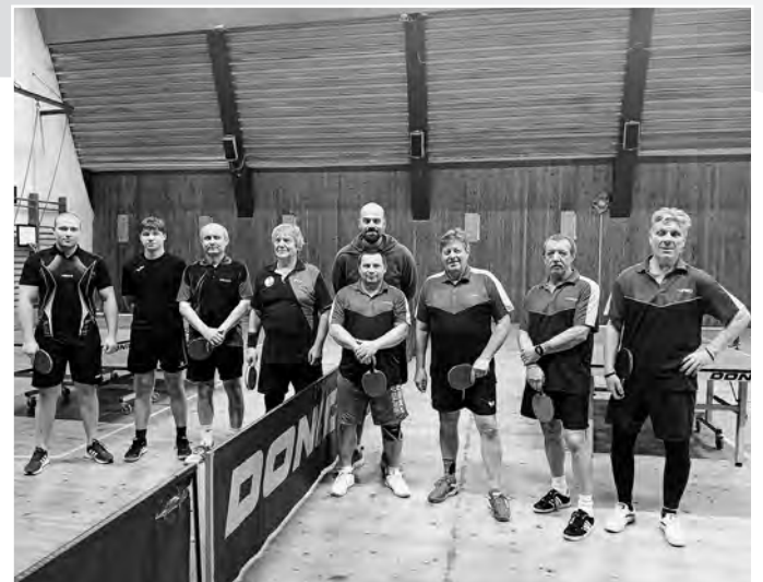
Pred zápasom 12. kola 4. ligy Dubová-Podbrezová B – Podlavice C

patrí 10. miesto zo 14 účastníkov s bilanciou 5 výhier, 3 remízy a 11 prehíer. Najlepším naším hráčom v tabuľke úspešnosti je Marek Benko na 15. mieste.