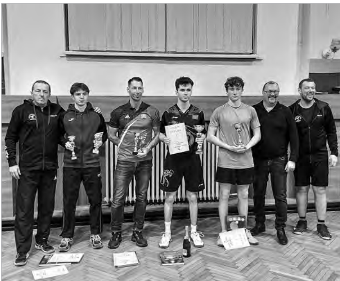
Ocenení na oblastných majstrovstvách v Selciach