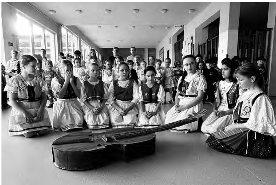
Fašiangy s pochovávaním basy v podaní dievčat z literárno-dramatického odboru ZUŠ