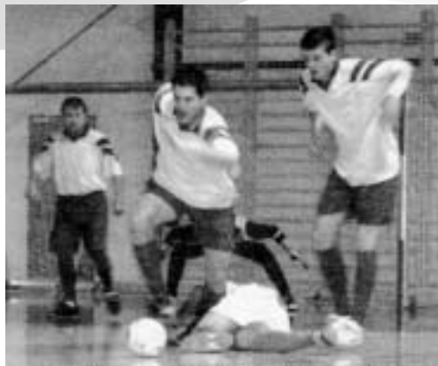
Zo zápasu so Šalkovou „B“