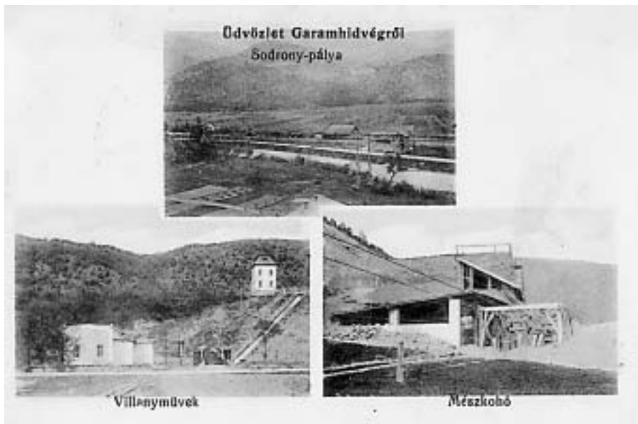
Historická pohľadnica – Pozdrav zo Zámotia z roku 1917: Železničná trať so stanicou, malá vodná elektrárňa a vápenka

Poznámka: V Nemeckej je pôvodným telesom trate súčasná komunikácia na Školskej ulici. Terajšie teleso trate za železničnou zastávkou Nemecká na tomto úseku spolu s novým mostom cez Kostolný potok bolo vybudované v roku 1938. Preložením sa zväčšil polomer oblúka trate pod školou, čo umožnilo zvýšiť rýchlosť prechádzajúcich vlakov.