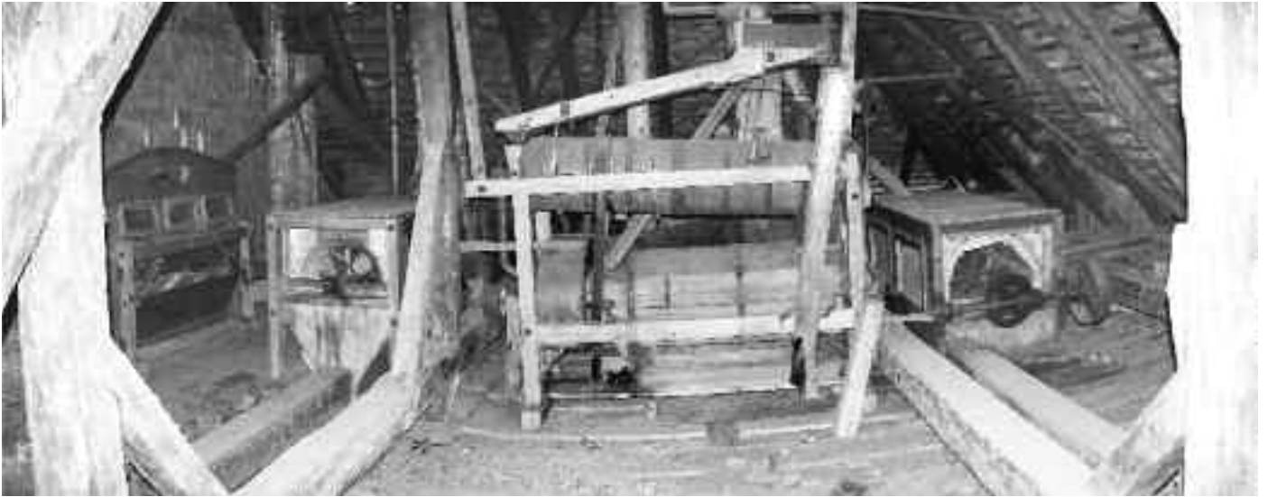
Interiér predajniarskeho mlyna