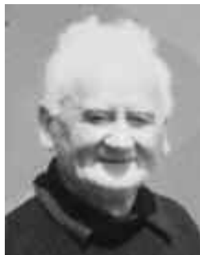
V roku 1991

v tme, aby nevedel, či je noc alebo deň, a podrobovali ho fyzickému násiliu. Vo väzení strávil sedem mesiacov. Odsúdili ho za trestný čin poburovania proti republike a zneužitia náboženskej funkcie na tri roky odňatia slobody, päť rokov pozbavenia občianskych práv a slobôd a 5 000 Kčs pokuty. Väznili ho v Ilave, odkiaľ ho 4. mája 1953 prepustili na amnestiu prezidenta ČSR Antonína Zápotockého.