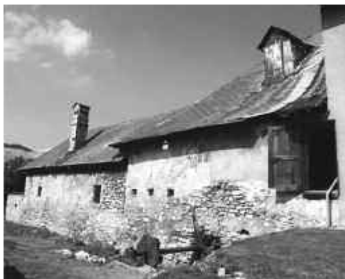
Exteriér predajnianskeho mlyna