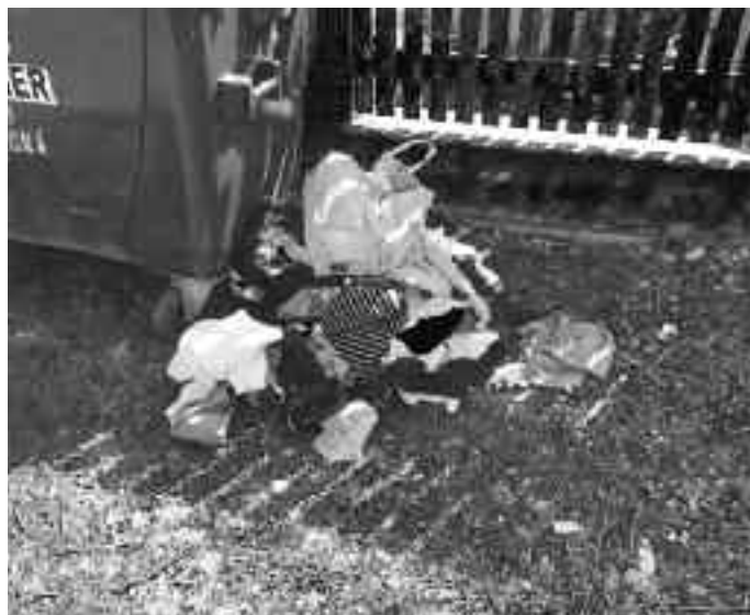
Textilný odpad na stojisku kontajnerov pri železničnej stanici v Nemeckej

stojiská kontajnerov čím ďalej tým častejšie. Preto je možné, že od nového kalendárneho roku obec prikróčí k odstráneniu nádob a všetky separované zložky sa budú zbierať formou vrecového zberu podobne ako plasty. Časté prepĺňanie kontajnerov na separovaný zber je zapríčinené hlavne tým, že občania do nich umiestňujú komunálny odpad. Druhým dôvodom je nedostatočná úprava separovaných zložiek: plastové fľaše a tetrapaky nie sú postláčané a papierové škatule nie sú rozložené, čo neúmerne zvyšuje ich objem. Dôrazne upozorňujeme, že ukladať odpad mimo kontajnerov je zakázané!