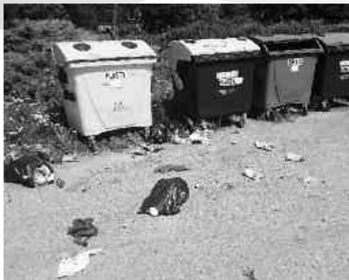
Stojisko kontajnerov v časti Dubová-kolónia: komunálny odpad uložený k nádobám na separovaný zber po návšteve zvierat, ktoré odpad rozniesli po verejnom priestranstve

V našej obci sú rozložené nádoby s objemom 1 100 litrov na triedený zber s farebným označením pre jednotlivé zložky. Detailný popis spôsobu triedenia a zvozu jednotlivých zložiek je zverejnený na internetovej stránke obce www.nemecka.info . Tieto kontajnery sú veľmi znečisťované a ich údržba si vyžaduje veľké finančné prostriedky. Zamestnanci obce sú nútení čistiť