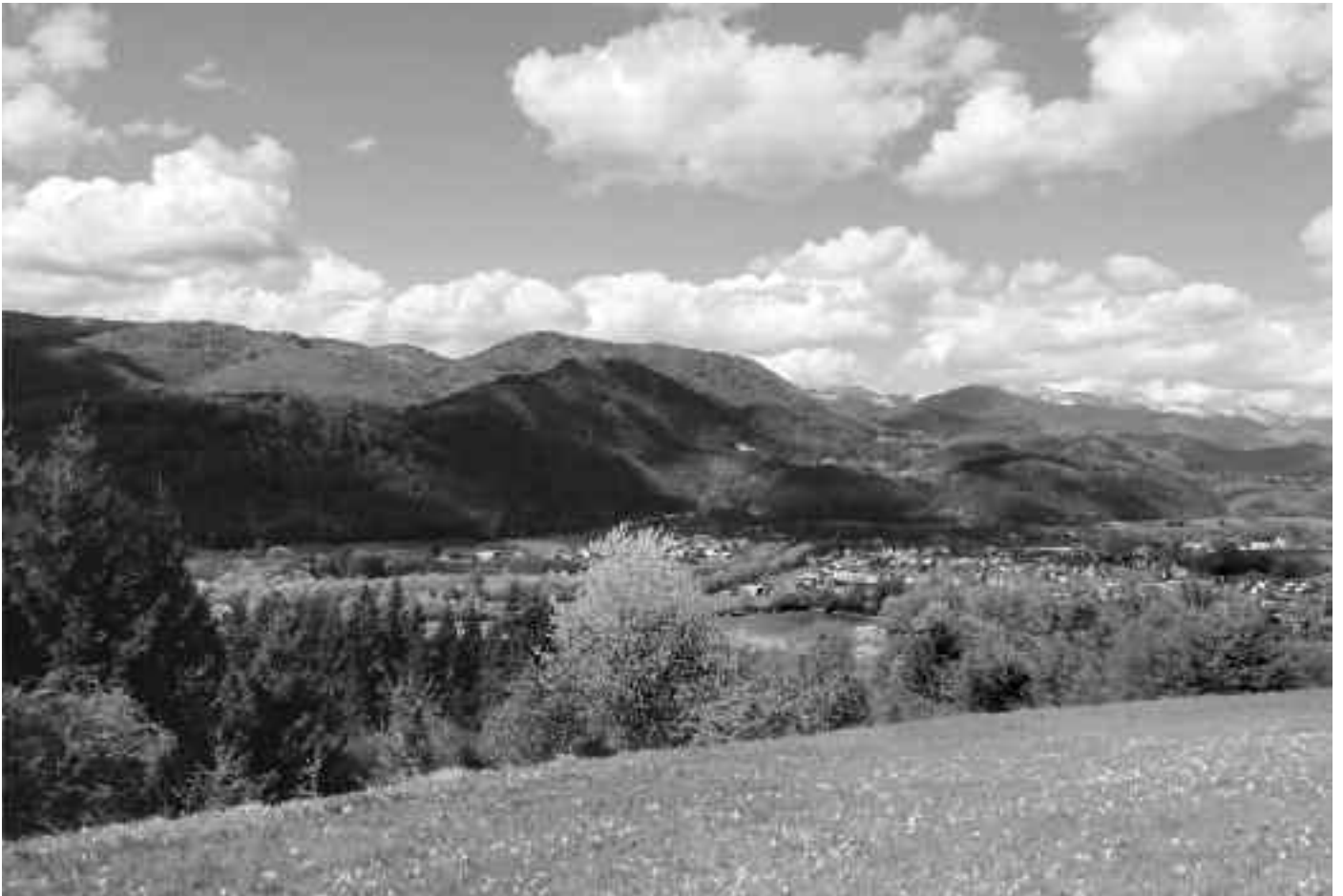
Pohľad na Nemeckú a Nízke Tatry spod Revišťa