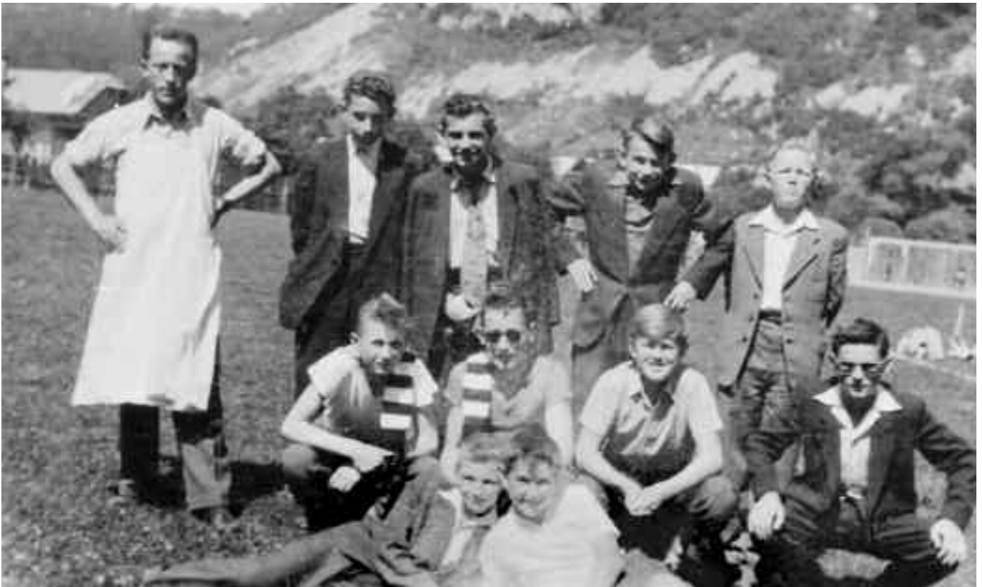
Pred zápasom so ZUŠ Mýto na ihrisku v Nemeckej