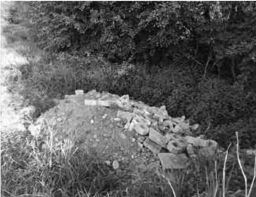
Čierna skládka drobného stavebného odpadu za čističkou odpadových vôd v Nemeckej

Ak sa v triedení KO výrazne nezlepšime, s istotou dôjde k navýšeniu poplatkov. Je medzi nami veľa zodpovedných ľudí, ktorí ku triedeniu odpadov už teraz pristupujú dôsledne. Za to im patrí veľké poďakovanie. Na druhej strane sú medzi nami leniví a nezodpovední občania, ktorí nielenže netriedia odpady, ale svojou činnosťou a nedôsledným prístupom dehonestujú prácu ostatných.