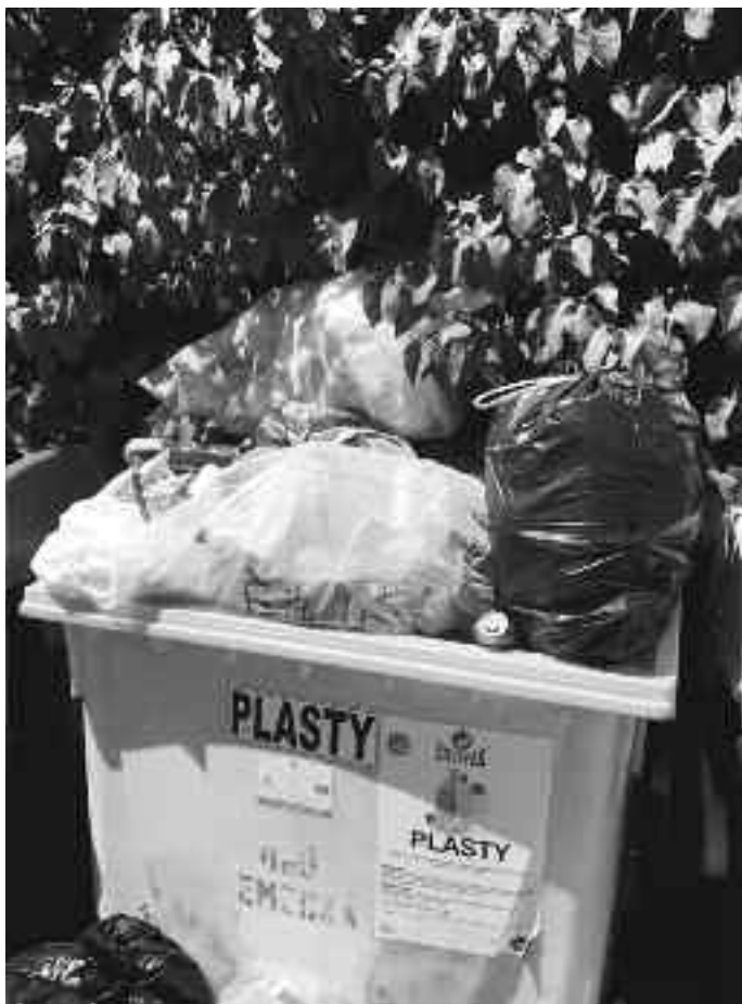
Preplnené kontajnery na separovaný zber – dôsledok nedostatočnej úpravy odpadov

■ V našej obci sa stále častejšie vyskytujú čierne skládky odpadov. Dochádza aj k veľkému znečisteniu kontajnerov určených na separovaný zber, ktoré sú umiestnené na stálych stojiskách v obci. Preto považujeme za nutné znovu popísať problematiku separovaného zberu a nakladania s komunálnym aj so stavebným odpadom.