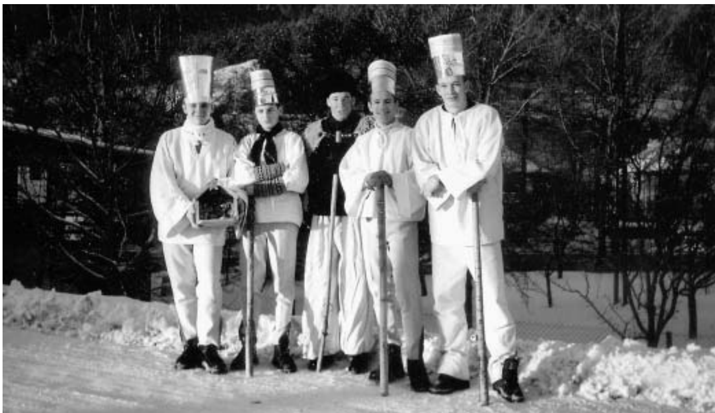
Betelehemci z Nemeckej (Vianoce 2002)

Večerať sa začínalo, keď vyšla prvá hviezdička alebo keď začali v kostole zvoniť. Tento moment bol hlavne deťmi netrpezlivo očakávaný, keďže celý deň sa držal pôst. Tomu boli prispôsobené aj jedlá na štedrovečernom stole, z ktorých bolo vylúčené mäso. Na začiatku sa gazda v spoločnej modlitbe