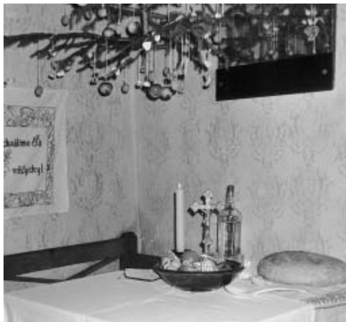
Rekonštrukcia štedrovečerného stola

Po návrate z polnočnej omše sa zvyklo dodržiavať pravidlo, že do domu mal vstúpiť ako prvý chlap. Keďže po polnoci sa už mohlo jesť mäso, na príchodzích už väčšinou čakala varená alebo pečená klbáska a jaternica ( hurka ). Opäť sa zohriala pálenka a spať sa chodilo okolo druhej – tretej hodiny.