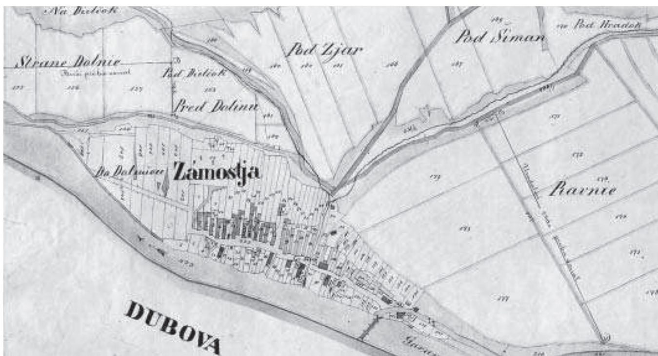
Zámostie na mape veľkej mierky z roku 1874