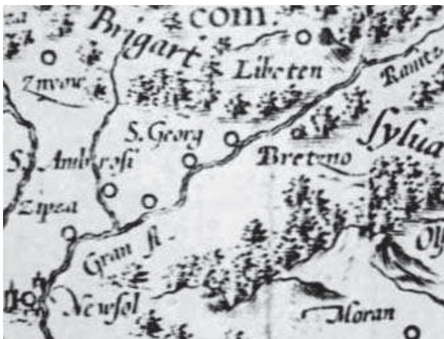
Okolie Dubovej na Mercatorovej mape Uhorska okolo roku 1585 ( Cart. Hung. I., list 5 )

Mapa Uhorska, ktorú vypracoval Gerard Mercator, vyšla tlačou okolo roku 1585. Mapové dielo schematicky zachytáva i dolinu Hrona. Tieňovaná kresba stromov zobrazuje pohoria. Pozdĺž Hrona pomenovaného ako Gran fl. medzi Banskou Bystricou ( Neusoll ) a Breznom ( Bretzno ) sú kruhovou značkou zakreslené štyri sídla. Mestečko Lupča je zaznamenané v mierne deformovanej podobe Lipza . Zhodne s Lazarovou mapou je nesprávne pomenovaný Sv. Ondrej ( S. Ambrosi ). Dielo prevzalo bez zmeny aj názov použitý pre Lopej ( S. Georg ). Nepomenované sídlom mapa situuje na pravý breh Hrona medzi Sv. Ondrejom a Lopejom. Znázornenie v podobe krúžku už bez značky kostola poukazuje na zjednodušené prevzaté údaje z mapy z roku 1528. K doplňujúcim údajom v mape patrí popis horného toku Hrona na úseku východne od Brezna v podobe Ranitz fl. Zápis zodpovedá zneniu „Hronec“. Pod týmto názvom však vystupoval Čierny Hron, ľavostranný prítok rieky západne od Brezna. Severovýchodne od Brezna Mercatorova mapa ozna-