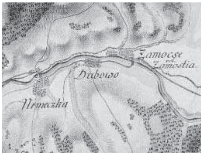
Nemecká, Dubová a Zámotie na mape I. vojenského mapovania z roku 1783 (EKF, Coll. XV., Sect. 8)

uvádza kostol v Dubovej. Hron tečie popri obci a dá sa rovnako ako pri Nemeckej prejsť aj bez mostov. Ostatné body sú spoločné pre všetky obce. Vysoký smrekový porast sa nachádzal smerom k holiam. Lúky boli suché a cesty priemerné. Okoliu dominoval vrch priamo nad obcami (EKF, XV./8, 13-15).