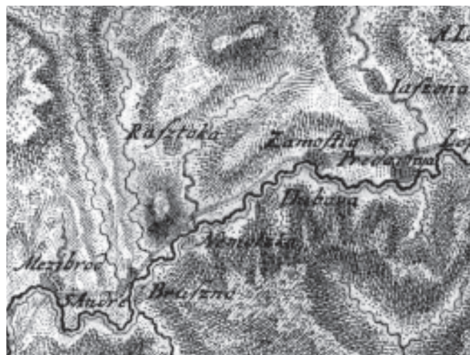
Nemecká, Dubová a Zámotie na Mikovíniho mape Zvolenskej stolice z roku 1736 (Bel, 1736)

Zaujímavé poznatky o krajine i obciach poskytuje vojenský opis krajiny ( Landesbeschreibung ), ktorý bol súčasťou mapovania. Pozostával z viacerých bodov, ktoré tvorili popis záväzný pre každé územie. Pri jednotlivých obciach bola uvádzaná vzdialenosť od susedných sídiel v hodinách. Vzdialenosti jednej hodiny zodpovedalo 5000 krokov. V ďalšom bode opis obsahoval údaje o pevných stavbách, vybudovaných zvyčajne z kameňa. Údaj o vodných tokoch zohľadňoval predovšetkým ich priechodnosť. K charakteristike prírodných podmienok sa zaradovali údaje o druhovom zložení lesov a využiteľnosti lúk a ciest pri prechode vojska. Opis uzatváral údaj o miestnych strategických bodoch. Pri hesle Nemecká opis spomína vzdialenosť 3/4 hod. od Sv. Ondreja a 1/2 hod. od Ráztoky. Pri Dubovej udáva vzdialenosť 1/4 hod. od Nemeckej a 1/4 hod. od Zámotia. Pri Zámotí opis zhodne uvádza vzdialenosť 1/4 hod. od Dubovej a 1/2 hod. od Predajnej. Ďalej charakterizuje Nemeckú ako malú obec pri Hrone. Ako pevnú stavbu