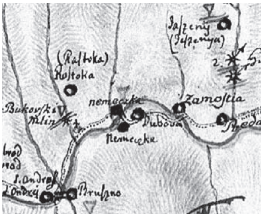
Nemecká, Dubová a Zámotie na Lipského mape Zvolenskej stolice z roku 1799 (Lipszky, com. Zol.)

v doline Hrona okrem polohy sídiel Nemecká (obidve strany rieky), Dubová (ľavý breh) a Zámotie (pravý breh) aj významnejšie geografické body v okolí. Severne od obce Nemecká, ako aj v oblasti Brusna mapa zakresľuje kyselku či minerálny prameň. Hradská cesta prechádza od Zámotia po Nemeckú po ľavej strane rieky Hron. V Nemeckej cesta prechádza na pravú stranu rieky a pokračuje ďalej k potoku Bukovec (nepomenovaný), na ktorom je vyznačený mlyn nazvaný Bukovský mlyn . Pozoruhodné zobrazenie poskytuje mapa v priestore na sútoku Bukovca s Hronom, kde pri hradskej zobrazuje kaplnku.