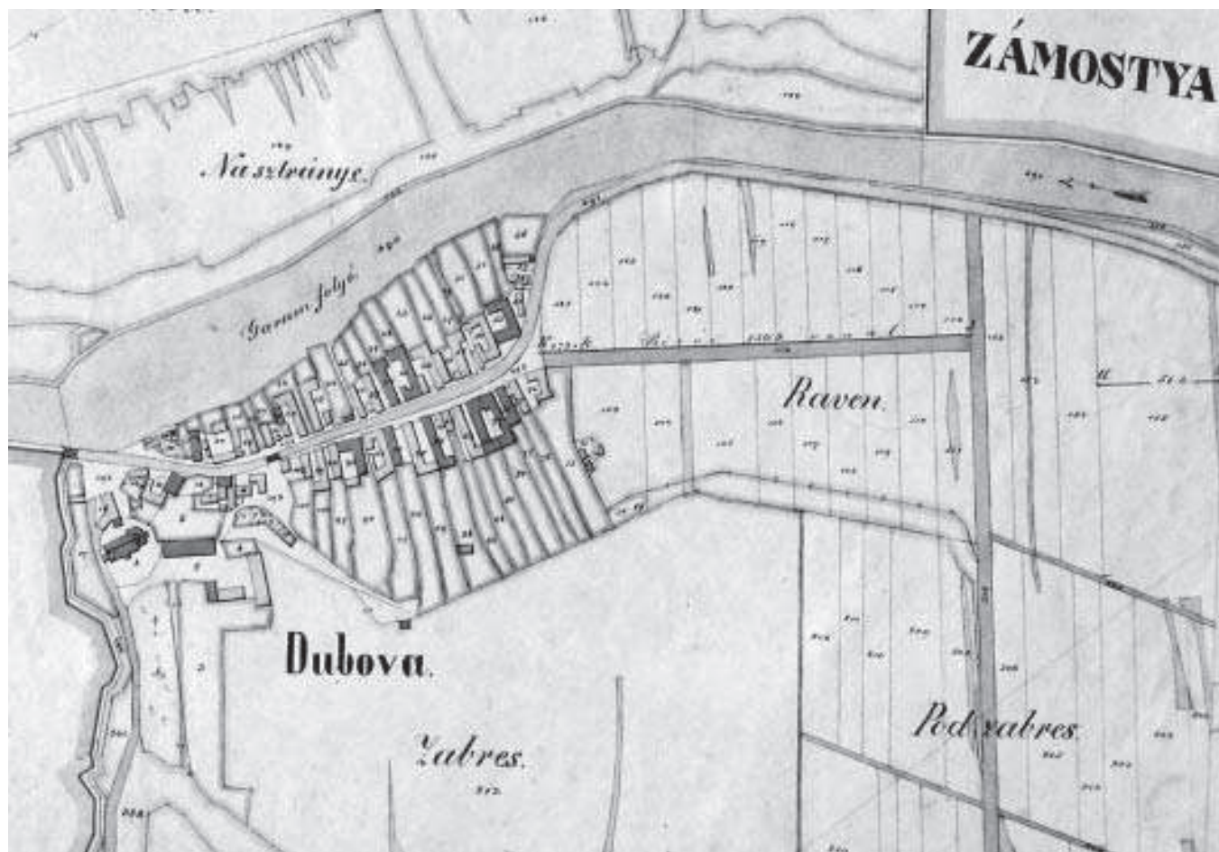
Dubová na mape veľkej mierky z roku 1874 (ŠA KSBB)

Na základe zobrazení pôdorysov obcí možno usudzovať, že pôvodné drevené domy začínali v predchádzajúcom období nahrádzať kamenné stavby. Murované domy tvorili v 70. rokoch 19. stor. v Nemeckej a Dubovej už takmer polovičný podiel z obývaných domov. Surovinu na výstavbu domov získavali