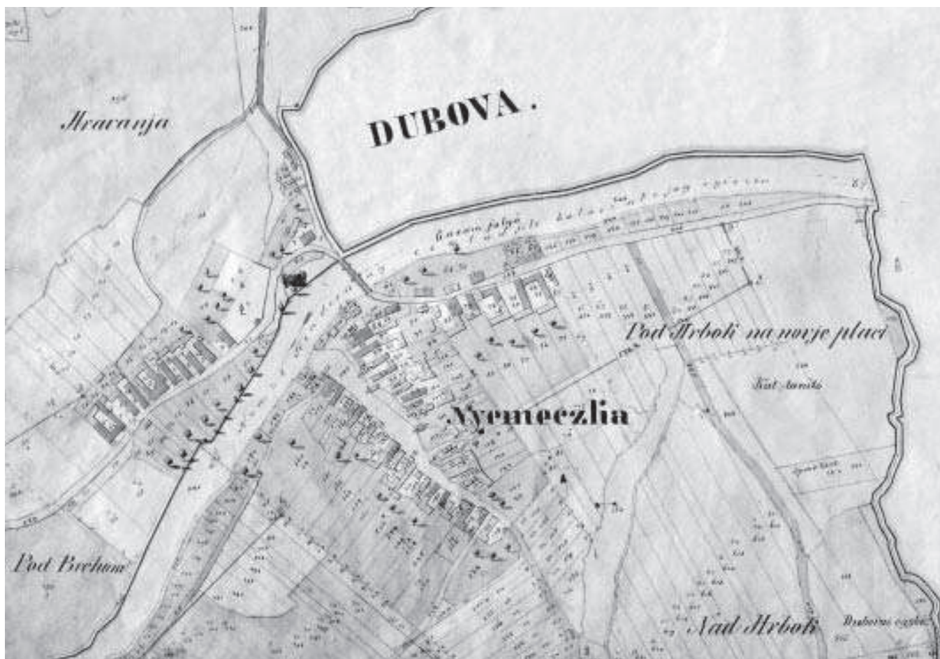
Nemecká na mape veľkej mierky z roku 1872

Výraznejšie zmeny možno pozorovať v pôdorysoch sídiel a tiež vo vývoji a využití jednotlivých komunikácií. Prvé zmeny v pôdoryse Nemeckej v porovnaní s jej základným tvarom prebehli koncom 19. stor. Začína sa výstavba domov na ulici pozdĺž krajinskej cesty smerom na Dubovú po vymeraní