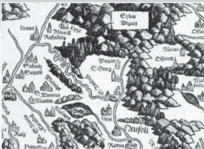
Okolie Dubovej na Lazarovej mape Uhorska z roku 1528 (Cart. Hung. I., list 1)

Historické mapy sú dôležitým prameňom pre sledovanie vývoja krajiny. Výnimkou nie je ani súčasné katastrálne územie Nemeckej. Historické osídlenie vstupovalo na tomto území do priestoru, v ktorom sa muselo prispôbovať osobitým podmienkam miestnej krajiny. Polohu pôvodných sídiel určil tok Hrona, pozdĺž ktorého postupovalo osídľovanie. Nadmorská výška tvorila z hľadiska limitov prírodného prostredia stredne