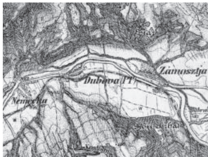
Nemecká, Dubová a Zámotie na mape III. vojenského mapovania z roku 1876 (VZÚ, Sekce 4463/3)

Mapa druhého vojenského mapovania prináša cenné informácie o využití pôdy. Možnosť presnej lokalizácie jednotlivých foriem využitia zeme umožňuje metóda šrafovania zobrazujúca reliéf a predovšetkým farebná škála použitá pre označenie rôzneho využitia pôdy. V porovnaní s prvým vojenským mapovaním možno konštatovať, že vo vzťahu k odlesneniu krajiny narástla plocha lesa. Les postúpil aj na tie lokality, ktoré boli predtým odlesnené. Na zarastanie niektorých lokalít poukazuje aj pôvod ich názvov. Opätovne sú zalesnené lokality Veľký Žiar, Žiarik a tiež výmoľovou eróziou poškodené okraje pravostranných terás Hrona. Naopak, odlesnené boli južné svahy Čierneho dielu, kde les rástol už len fragmentárne a prvé holiny sa objavujú aj v doline Bystrého potoka. Na rozparcelovanie ornej pôdy na úzke políčka upozorňuje jemné šrafovanie severne a východne od Zámotia a južne od Nemeckej a Dubovej. Hrubšie rovnoobežné línie v niekoľkých sledoch vedľa seba poukazujú na vznik výrazných medzí vytvorených dlhodobou orbou pôdy.